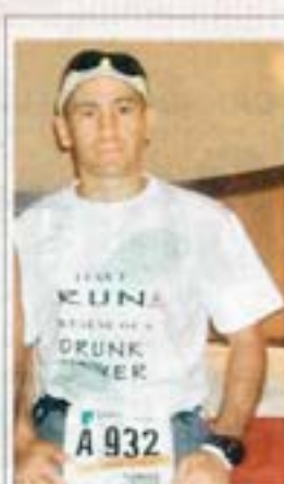
Ramón protestó en Chicago el año pasado.

“El término preebriedad no debería existir; es una alcahuetería. Nadie que haya tomado licor debe conducir”, dijo el médico.