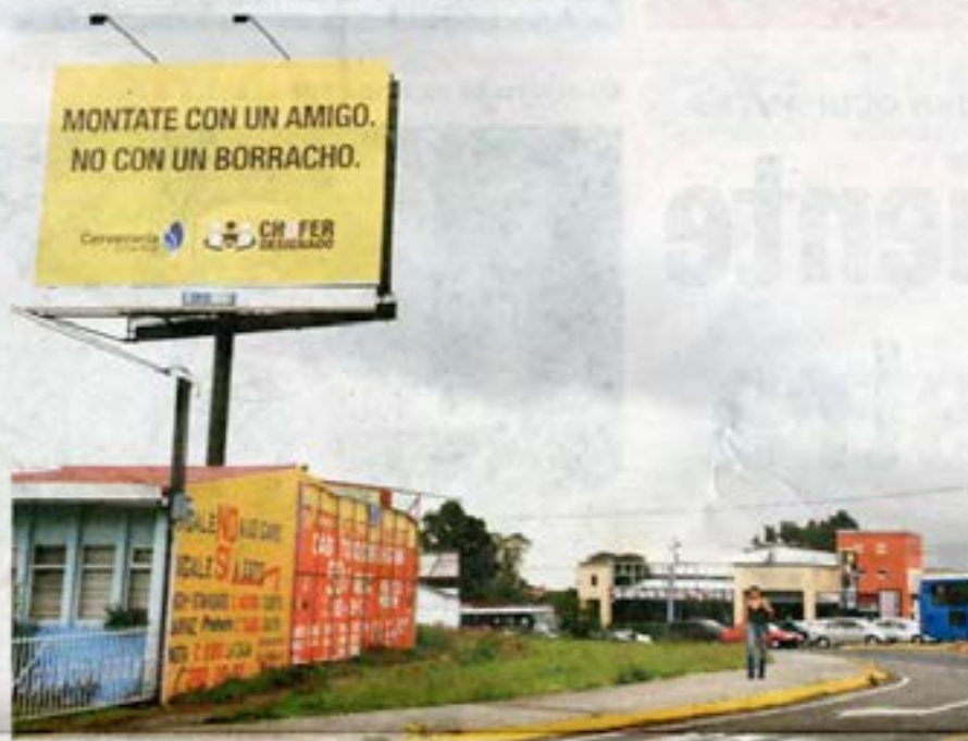
El programa “Chofer designado” nació en 1998, y hoy la campaña es más fuerte.